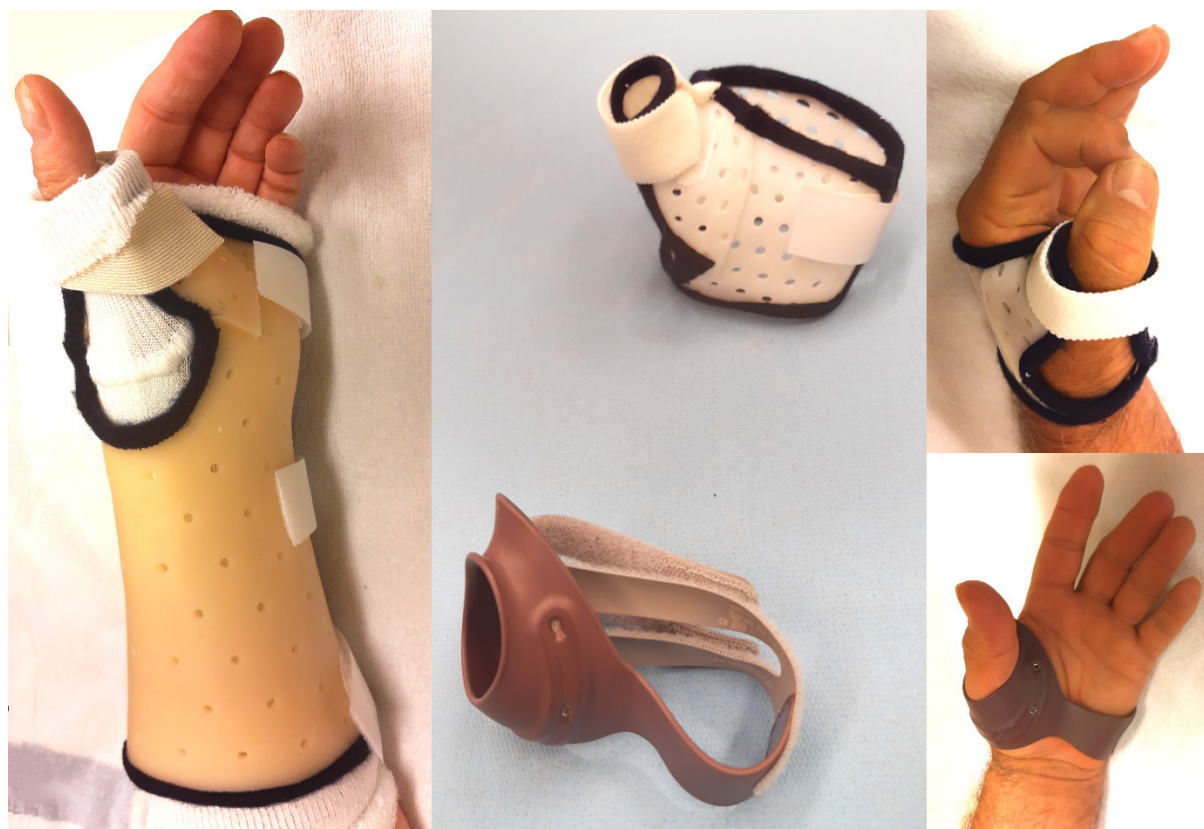
FIGURE 2. Les différentes attelles qui peuvent être prescrites lors de la prise en charge d'une rhizarthrose

À gauche, une attelle thermoformable de repos qui immobilise toute la colonne du pouce et le poignet. Au milieu, deux attelles de fonction : une attelle thermoformable (en haut) moulée sur la main du patient, et une attelle du commerce disponible en plusieurs tailles (Push ortho Thumb Brace CMC, Nea International bv, Maastricht, The Netherlands). À droite sont illustrées les attelles de fonction qui permettent la réalisation des activités quotidiennes.