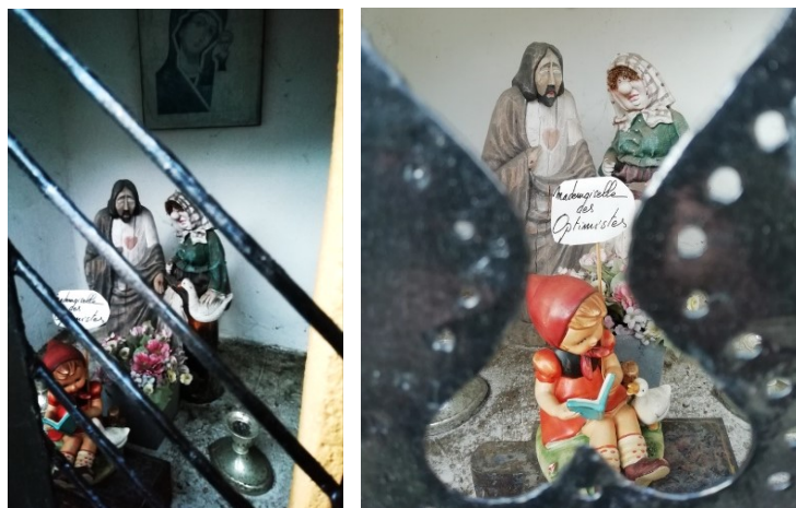
6a et 5. Notre-Dame des Affligés, rue du Bauloy. Intérieur de la niche, situation à l'automne 2020. (Photo : É. Bousmar, 25 octobre et 4 octobre 2020)

La surprise est à l'intérieur (fig. 5 et 6a). Deux statuettes sont placées debout, devant le mur du fond. Celle de gauche est d'un beau