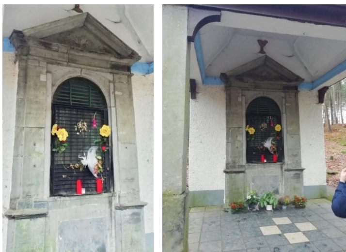
7a et 7b. Notre-Dame des Affligés à Tilly (Villers-la-Ville) : niche monumentale, 1731, sous un auvent, dans les bois. La grille et le pied du monument sont fleuris. (Photos : É. Bousmar, 28 décembre 2020)

et s'arrête à la chapelle, avant de revenir à l'église paroissiale 50 . Cette manifestation est spécifiquement dénommée « procession de Notre-Dame des Affligés » 51 et a joué un fort rôle d'attraction régionale durant la première moitié du 20 e siècle. Un observateur de la procession et de sa kermesse en mai 1928 décrit un « jour de piété et de folie », où la foule afflue à vélo et en voiture, où se mêlent des mendiants, des mutilés, des diseuses de bonne aventure, où la fête foraine – traversée par la procession avec sa fanfare et ses