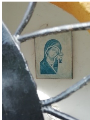
6b. Notre-Dame des Affligés, rue du Bauloy. Reproduction d'une icône accrochée au mur du fond. (Photo : É. Bousmar, 28 octobre 2020)

Telle était la situation à l'automne 2020. Depuis lors, deux éléments nouveaux ont été successivement ajoutés, entre le couple d'adultes et la petite demoiselle des Optimistes. Il s'agit d'abord d'un buste de la Vierge en céramique. On notera que les doigts de la main de Celle-ci, qui retient son voile, portent un vernis à ongles rouge particulièrement voyant (fig. 6c). Plus récemment encore, est arrivée la statuette en bois d'un homme barbu, en bure d'ermite ou de moine, tenant un livre ouvert en main gauche et montrant un passage de la main droite. Il pourrait sembler faire la leçon à la petite fille, ou lui raconter une histoire, ou simplement parler sans qu'elle ne l'écoute (fig. 6d) 13 .