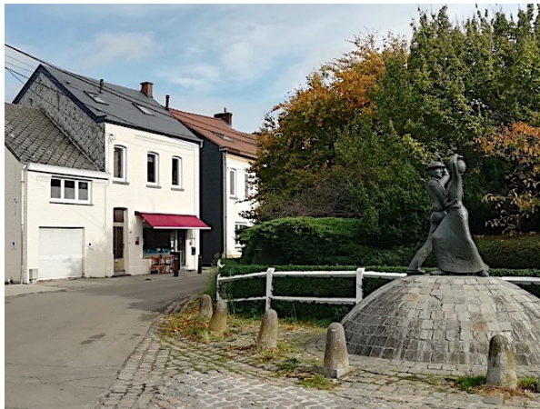
12a et 12b. Monument des Vîs Tchapias , rue du Bauloy. Ottignies. Détail. Situation générale. (Photos : É. Bousmar, 28 octobre 2020)