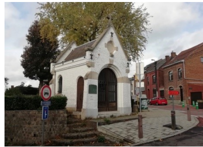
10. Chapelle du Stimont (Marie-Médiatrice). À droite, rue de la Chapelle. (Photo : É. Bousmar, 28 octobre 2020)

Ch. SCOPS, Ottignies... , op. cit. , p. 53-55 (et erratum); Ch. SCOPS et R. HAVERMANS, Ottignies... , op. cit. , p. 92-93 (mention et photo, les briques étant non peintes); C. MASONI, Ottignies-Louvain-la-Neuve, ville universitaire , direction photographique de L. HAVENITH, préface de Y. DU MONCEAU DE BERGENDAL, Paris-Gembloux, Duculot, 1987, p. 48 (photos de l'extérieur de la chapelle du Stimont, désormais peinte en blanc, et de quatre des céramiques qui y sont exposées); J. DESMET, Ottignies-Louvain-la-Neuve, ville universitaire à la campagne , direction photographique de L. HAVENITH, préface de J. OTLET, Bruxelles, Racine, 1997, p. 17 (mention) et p. 40-41 (photos de l'extérieur et de céramiques); Histoire et patrimoine... , op. cit. , p. 187 (mention); Patrimoine architectural... , op. cit. , vol. 16, p. 196 (carte topographique) et p. 206 (mention brève, avec photo); IPIC , fiche n° n° 25121-INV-0148-01, rédigée par B. STREEL, s. d., consultée le 24 octobre 2020; F. BAUS, M. BERTRAND, E. PAÏE, avec la coll. de J.-M. LECHAT, Le patrimoine d'Ottignies-Louvain-la-Neuve... , op. cit. , p. 30. La chapelle est absente du Patrimoine monumental... , op. cit.