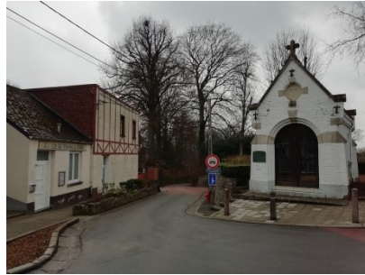
9. Chapelle du Stimont (Marie-Médiatrice). À gauche, local des Vis Tchapias. Au fond, entrée du collège (à gauche) et descente de la Montagne du Stimont (tout droit). (Photo : É. Bousmar, 9 mars 2021)