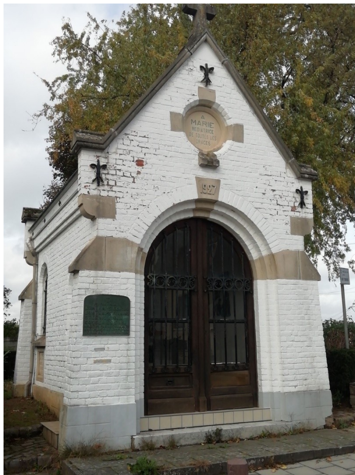
11. Chapelle du Stimont (Marie-Médiatrice), situation actuelle. (Photo : É. Bousmar, 28 octobre 2020)

quelques chaises ou bancs. Il n'est pas anodin que la dévotion à Marie médiatrice de toutes les grâces ait été portée par un Brabançon wallon d'envergure internationale, le cardinal Mercier († 1926), dont le décès précède de peu la fondation. Celui-ci possédait d'ailleurs une statue de Marie-Médiatrice en plâtre peint, à laquelle il était attaché ; après le décès du cardinal, cette dernière fut reçue, à la