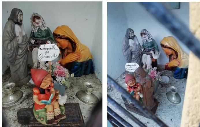
6c. Chapelle Notre-Dame des Affligés, rue du Bauloy. Intérieur de la niche. Situation après ajout d'un buste de la Vierge. (Photo : É. Bousmar, 8 février 2021)