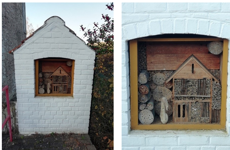
13a et 13b. Ancienne chapelle Notre-Dame de Lourdes, à Ottignies (Bauwin, n° 44), transformée en nichoir à insectes. Vue d'ensemble et détail.

des Wallons... 74 À quelques centaines de mètres en contrebas du lieu qui nous occupe, la niche de la petite potale de la rue Montagne du Stimont, autrefois consacrée à Notre-Dame de Lourdes, abrite un élégant nichoir à insectes (fig. 13a et 13b) 75 . Dans la chapelle Saint-