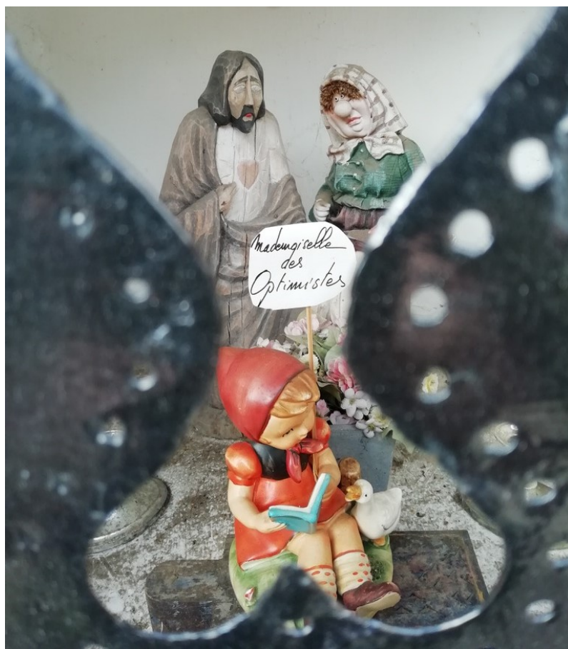
Ottignies-Louvain-la-Neuve, chapelle Notre-Dame des Affligés, rue du Bauloy. Intérieur de la niche, situation à l'automne 2020. (Photo : É. Bousmar, 4 octobre 2020)