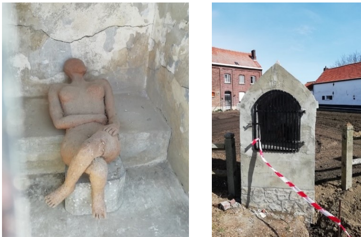
14a et 14b. Ancienne chapelle Saint-Antoine, à Cérroux, hameau du Puits (Bauwin n° 22). Intérieur de la niche. Vue d'ensemble.

qu'il s'agisse d'une réaffectation profane valorisant le bonheur terrestre 76 . Ces réemplois profanes contrastent avec l'impression de relatif abandon qui se dégage d'autres lieux 77 , et plus encore avec leur disparition pure et simple. À quelques dizaines de mètres de