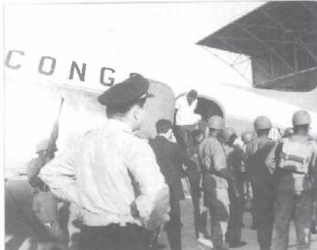
Des moments clés de la courte carrière politique de Patrice Lumumba : en haut, le signature de l'acte d'indépendance du Congo en 1960, le lendemain de la victoire électorale, son arrestation par les forces occidentales.

E n Belgique, on se souvient de l'assassinat de Patrice Lumumba, le 17 janvier 1961, par un groupe de militaires belges et hollandais. Mais, en Belgique, on se souvient aussi de l'assassinat de Lumumba par un groupe de militaires belges et hollandais. Mais, en Belgique, on se souvient aussi de l'assassinat de Lumumba par un groupe de militaires belges et hollandais.