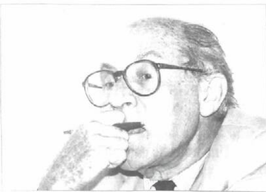
Un moment de son rendez-vous avec Philippe Jean Godeaux, l'ancien gouverneur de la Banque Nationale.

A insi que nous le dit dans son ouvrage, le président de la commission pour la spoliation des biens juifs, Jean Godeaux, dans un entretien accordé au Soir, le 26 juin 1997, « une œuvre de mémoire à accomplir. Les perspectives sont encourageantes. »