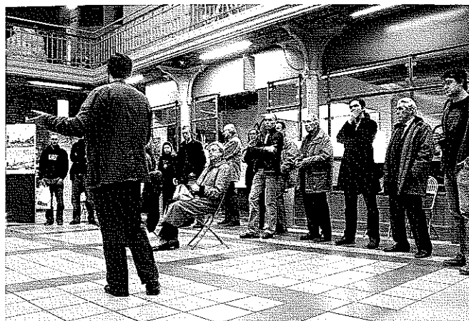
Fig 4. Le vernissage de l'exposition dédiée au schéma directeur « Botanique » le 12 décembre 2006 aux halles Saint-Géry