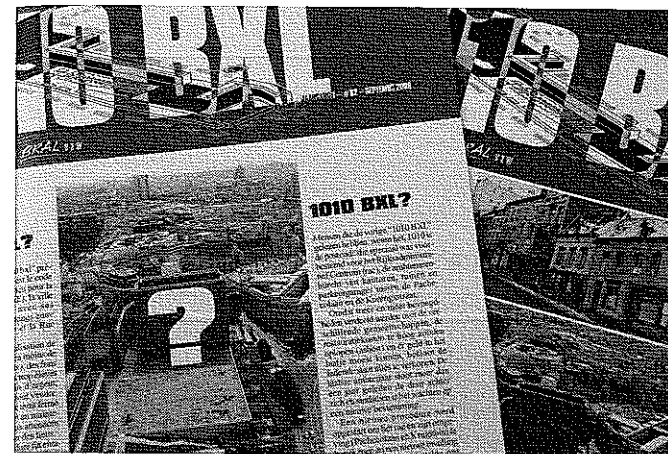
Fig. 1. Trois parutions de 1010 Bxl, en mars, septembre et décembre 2006, accompagneront la procédure d'élaboration du schéma directeur comme support au volet participatif ou public de celle-ci. Le titre de cette lettre d'information éditée par le BRAL fait référence au code postal de la Cité administrative de l'Etat

Après cela, il explicite le planning général du projet qui vise une mise en œuvre début 2009. Il annonce l'adoption du schéma directeur pour septembre 2006, un arrêté gouvernemental pour octobre et l'inscription dans un PPAS (plan particulier d'affectation du sol)