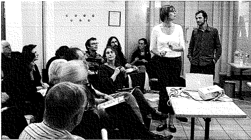
Fig. 3 La réunion publique d'information du 4 septembre 2006 à l'auberge de jeunesse Jacques Brel