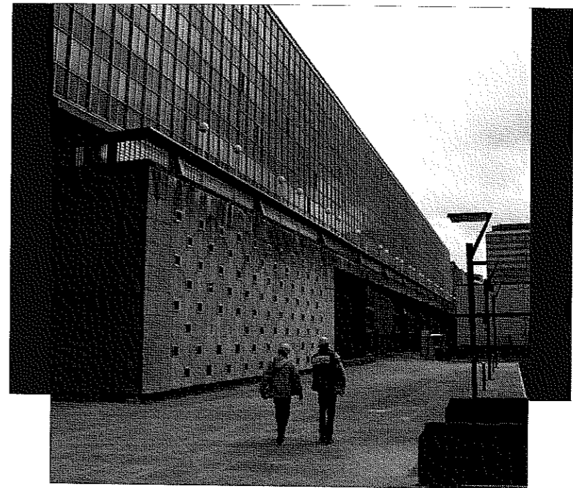
THE STATE ADMINISTRATION CITY

Schémas directeurs et action publique à Bruxelles