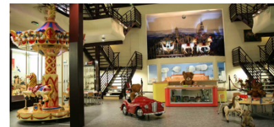
Illustration: Musée du Jouet de Colmar