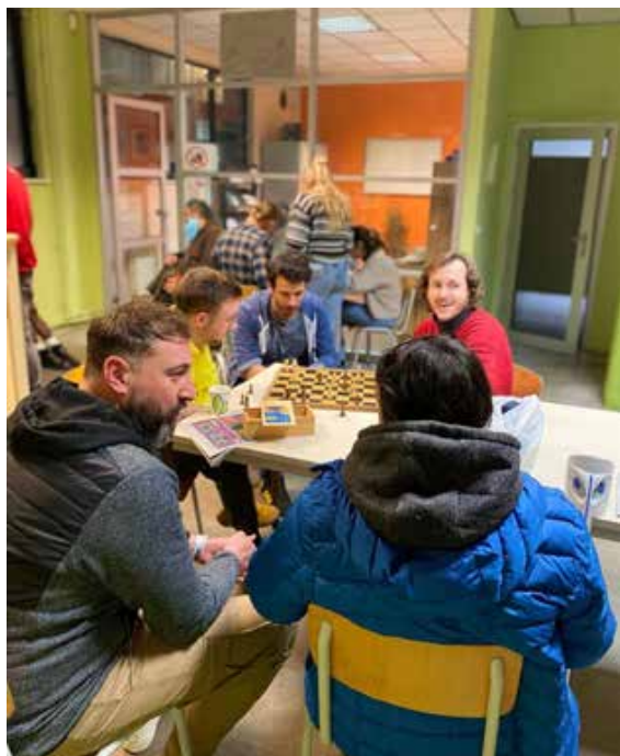
FIGURE 1. LA MASS (MAISON D'ACCUEIL SOCIO-SANITAIRE) DE BRUXELLES

La question de l'exclusion est étroitement liée au sujet des assuétudes. Quand une personne consomme une substance illicite, elle bascule simultanément dans le champ du hors-cadre, du hors-la-loi. Ce rapport entre actes de consommation et règles de société entretient une exclusion symbolique mais aussi concrète. Pour un usager de drogue, ce phénomène construit un rejet et une marginalisation durable avec notre système, notre société.