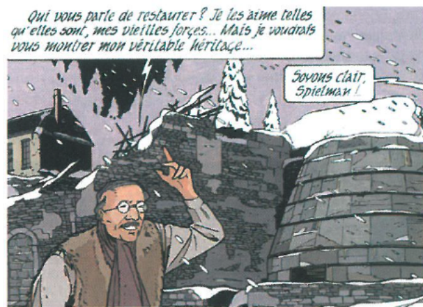
Le site de Mellier-Haut : une image de la sidérurgie au charbon de bois

Autre donnée paysagère de l'Ardenne sylvestre bien illustrée, à côté des grottes creusées depuis des millénaires par la percolation des eaux dans les zones calcaires (Han, Rochefort, Hoton, etc.) (par exemple dans Mittéi et M. Vasseur, La grotte aux esprits [Les 3A, t. 7]), ce sont les vallées qui entaillent profondément le plateau, à l'image des célèbres Fonds de Quareux de l'Ardenne liégeoise (G. Counhaye, Gorr, le loup et autres récits fantastiques). Mais si de nombreux auteurs en présentent des images convaincantes, signalons néanmoins Servais – encore lui ! – qui dans Les seins de café a situé toute son aventure dans la basse Semois, dans cette partie pittoresque du cours d'eau qui fournit des points de vue panoramiques d'une beauté extraordinaire, là où les rochers se battent avec les arbres dans leur course vers le ciel (Les seins de café. Édition intégrale).