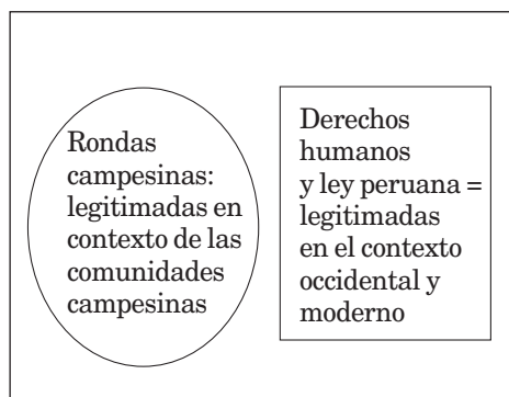
Esquema 2: Pluralismo completo

locales y limitados de funcionamiento dentro de un solo sistema general de justicia con pretensión de exclusividad y cobertura nacional” (Diez Hurtado, 2007: 70).