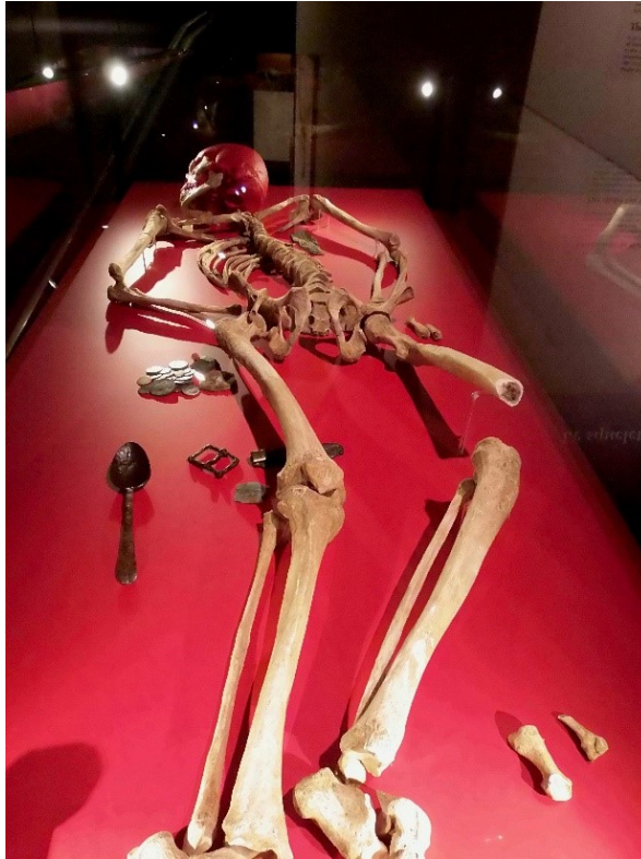
Le squelette découvert en 2012, exposé au Mémorial 1815, détail.