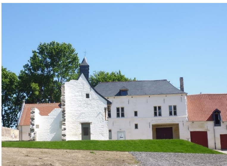
La Ferme d'Hougoumont restaurée, juste avant son inauguration (Photo : M.-A. Collet, juin 2015)

oncle, un ensemble d'objets, dont une bague, trouvés sur le champ de bataille. D'autres visites : la Ferme du Caillou à Vieux-Genappe, le Musée Wellington à Waterloo, le Musée 1815 à Ligny, la Ferme de Mont-Saint-Jean à Waterloo. Constitution d'une table de documentation (livres, cartes, reproductions). Vision d'un film sur la bataille, en l'occurrence le Waterloo de Sergueï Bondartchouk. Interventions d'invités en classe : Gareth Glover venant exposer son identification du squelette, Dominique Bosquet racontant la découverte lors des fouilles, Ronan Burgess testant avec les élèves un casque à réalité virtuelle retraçant la grande charge de la cavalerie française, et enfin le reconstituteur Quentin Jaumain, ancien élève de l'école, qui a passé une après-midi en hussard avec la classe.