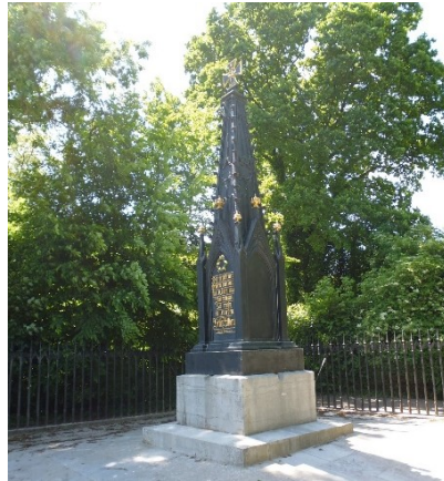
Monument aux Prussiens (1819) à Plancenoit, en bordure du champ de bataille de Waterloo.

les soldats de l'armée commandée par Wellington 16 . Quant à l'ossuaire présent dans le jardin de la Ferme du Caillou, il n'a été aménagé qu'en 1912 par le propriétaire de l'époque, par ailleurs collectionneur, et était destiné à entreposer dignement les restes humains remontés périodiquement par le charruage des agriculteurs. Une telle attention était bien tardive, et relevait en outre de l'initiative privée 17 . On rappellera enfin que le squelette « du hus-sard » exposé au musée de la Ferme du Caillou (« Dernier Quartier-Général de l'Empereur ») est un ensemble composite, qui ne correspond pas à un mort unique.