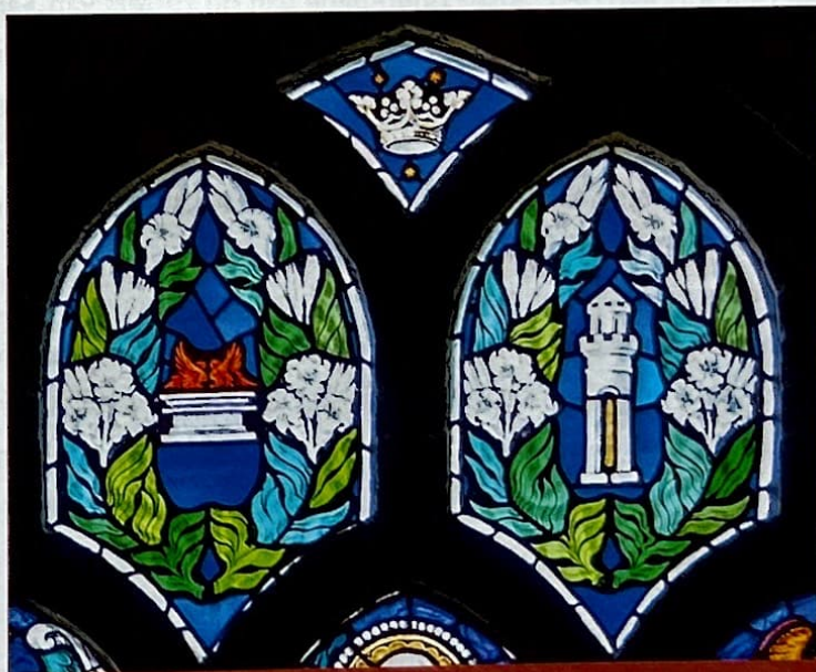
Maria als 'Ark van het verbond' en 'Ivoren toren', twee aanroepingen uit de Litanie van Loreto Detail uit het Maria-glasraam in de O.L.V.-kerk van Mannekensvere (Glasatelier Desmet-Van Caillie 1929; zie ook de afbeelding op de cover van dit nummer).

Later verlegt de auteur zijn aandacht van de inhoud van de ark naar de ark zelf. Vooreerst refereert hij aan Exodus 25,10, waarin wordt gestipuleerd dat de ark van 'sittimhout' (zie hoger) moest worden gemaakt. De Griekse Septuaginta vertaalde deze Hebreeuwse term als 'onvergankelijk'. De auteur van de Speculum combineert de Hebreeuwse en de Griekse tekst: 'De ark van het verbond was gemaakt van onvergankelijk sittimhout.' Zo ook was Maria op geen enkele wijze onderhevig aan vergankelijkheid ( putredine uel puluere ). De vier gouden ringen van de ark (Ex 25,12) zouden volgens de Speculum Humanae Salvationis dan weer staan voor de vier kardinale deugden, die Maria belichaamde: gematigdheid ( temperancia ), voorzichtigheid ( prudencia ), moed ( fortitudo ) en rechtvaardigheid ( iusticia ). In die vier vinden immers alle andere deugden hun oorsprong. In de twee gouden stokken waarmee