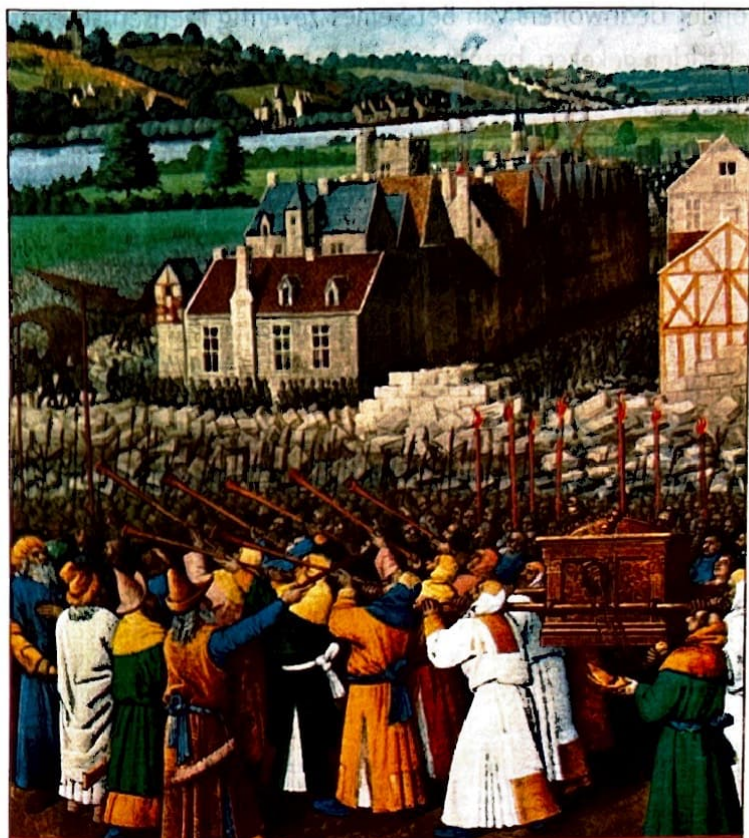
De ark wordt rond Jericho gedragen

Miniatuur van Jean Fouquet (ca. 1470) Ms. Fr. 247, Bibliothèque Nationale, Parijs